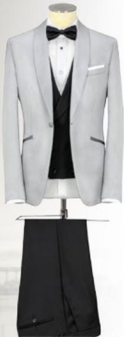
VESTE COL CHÂLE - TISSU GRIS PERLE LAINE ACÉTATE. POCHES EN BIAIS PASSEPOILÉES GILET CROISÉ - SERGE NOIRE UNIE S'110.