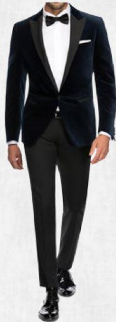
VESTE 1 BOUTON - COL CRANTÉ. REVERS SATIN TISSU VELOURS PALATINE PANTALON - SERGE UNIE 100 % LAINE NOIRE. CHEMISE COL CASSÉ - BOUTONS CACHÉS.