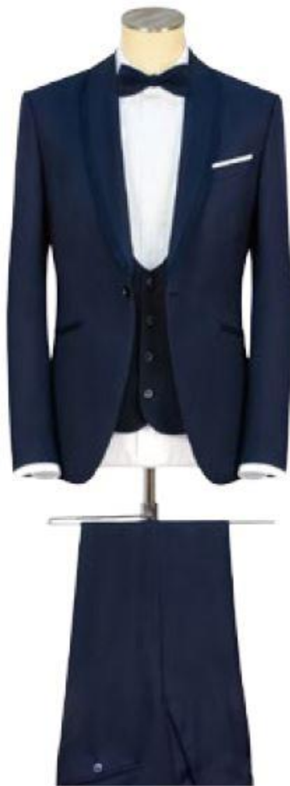
COSTUME 3 PIÈCES - VESTE COL CHÂLE 1 BOUTON AVEC BANDE DE 1 CM SERGE 100 % LAINE. CHEMISE COL ITALIEN AVEC BOUTONS CACHÉS - POPELINE 100 % COTON.